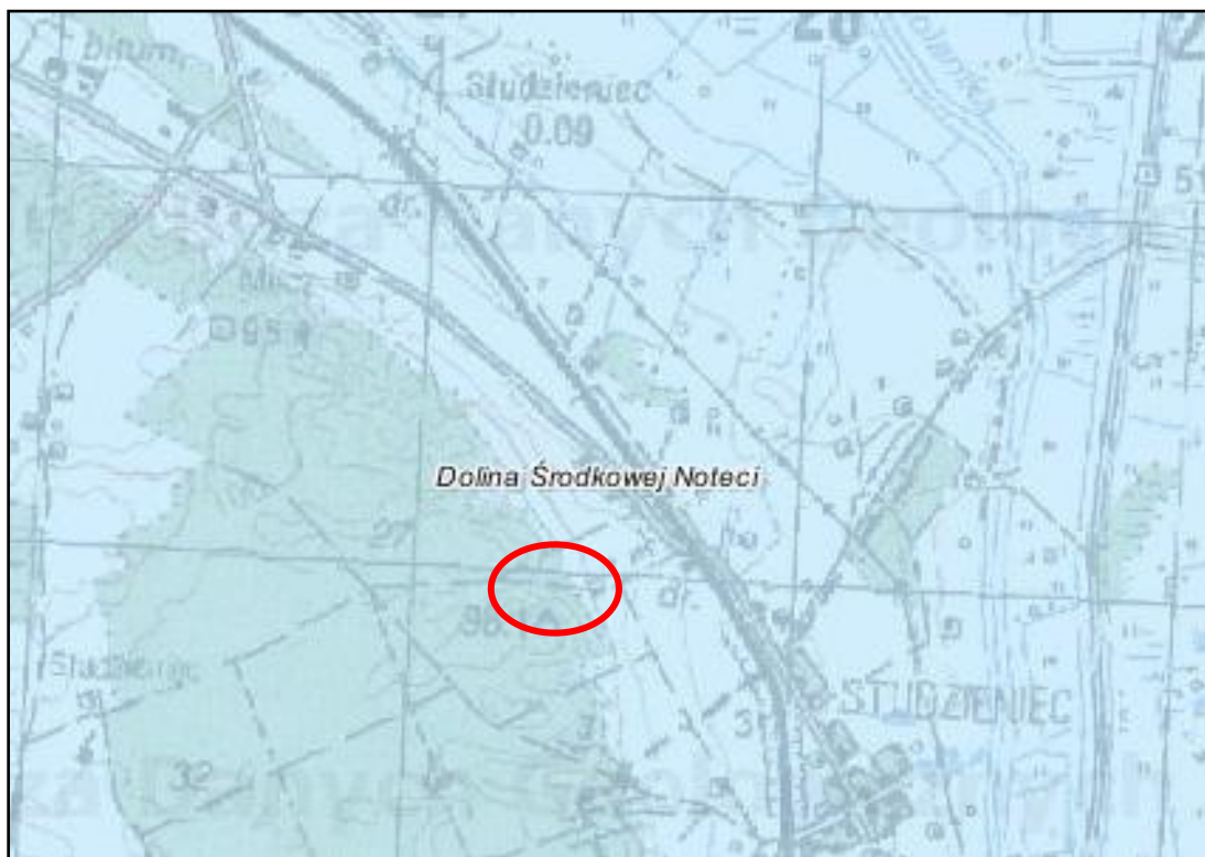
Ryc. 1 Położenie obszaru planu na tle struktur geologicznych

Według podziału geomorfologicznego Niziny Wielkopolskiej (B. Krygowskiego, 1961) obszar opracowania położony jest w zasięgu subregionu Odcinek Wyrzyski (C 2 ), który jest częścią regionu Pradoliny Toruńsko-Eberswaldzkiej.